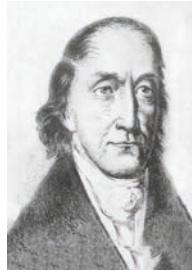
J. Ch. Friedrich GutsMuths 09.08.1759 - 21.05.1839

Schulgründer und 1. Direktor von 1784-1811