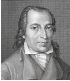
Christian Gotthilf Salzmann 01.06.1744 - 31.10.1811

Schulgründer und 1. Direktor von 1784-1811